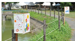
子どもらが描いた灯ろう(千灯祭)