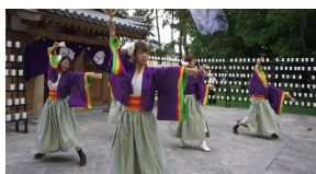
山之上住吉神社境内での舞

田んぼより一段高い位置にある池の土手(市道)は風とおしもよく播磨町大中公園へ、朝・夕散歩コースとして利用されています。国道2号線から見る景色は池の上に神社が浮いているかのように見えます。