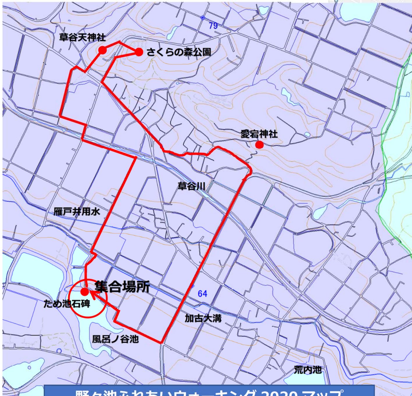
野々池ふれあいウォーキング 2020 マップ